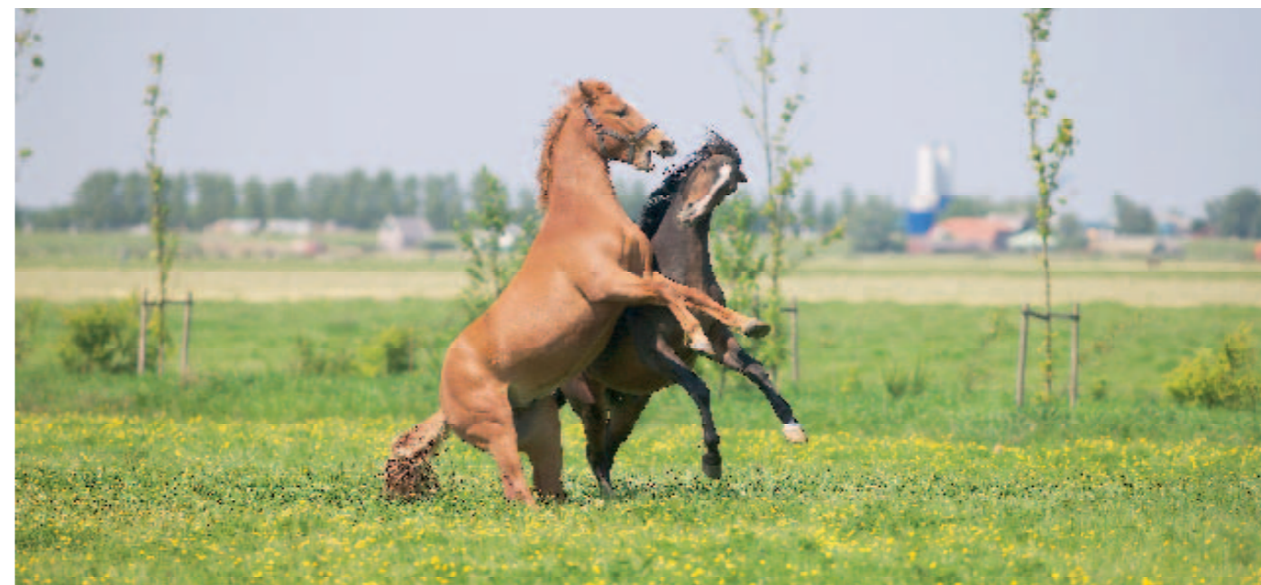
Wees alert op gevaren en risico's van weidegang.

Een staleigenaar die de paarden van zijn klanten buiten en binnen zet, hoort dit op verantwoorde wijze te doen.